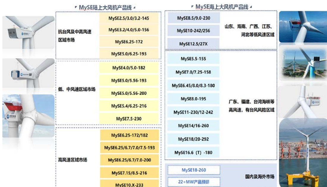
图：明阳智能风电整机产品线

公司风电整机制造板块包含大型风力发电机组及其核心部件的研发、生产、销售等业务。针对世界各地的不同风况和气候条件，包括低温、沙尘、台风、盐雾、高原等严酷环境，公司研发和设计了适应不同特殊气候条件的陆上和海上风机，形成了“覆盖当前、着眼未来”的多产品布局，包括单机功率覆盖 1.5-11MW 系列陆上型风机和单机功率覆盖 5.5-22MW 系列海上型风机。每个系列的风机又包含不同叶轮直径，适应不同地域、不同自然环境的风况特点。在同一叶轮直径基础上，公司根据不同环境条件推出了常温型、低温型、超低温型、宽温型、高原型、海岸型、抗台风型、海上型、海上漂浮式等系列机组。公司目前是国内风力发电行业产品品类最为齐全，布局最具前瞻性的领军企业之一。